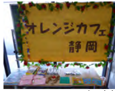
コーヒー・紅茶 ケーキそれぞれ 100円